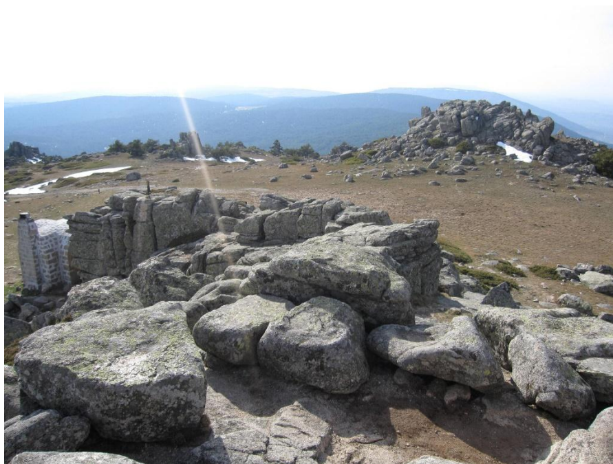
Cima de Cueva Valiente.