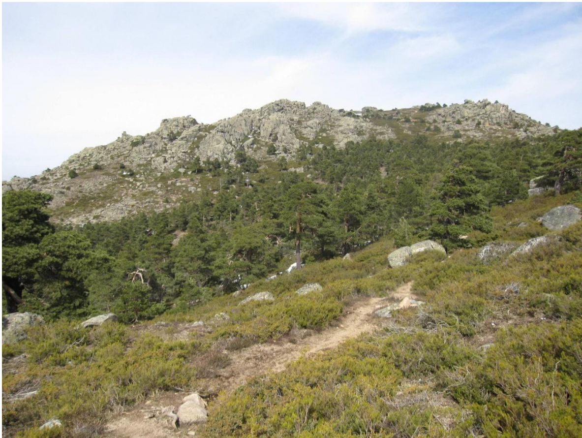
Cara Sur de Cueva Valiente

Continuaremos hasta la cueva que da nombre al pico, para desde ahí llegar a la Fuente Marques Juan Bellver y al collado de la Gargantilla.