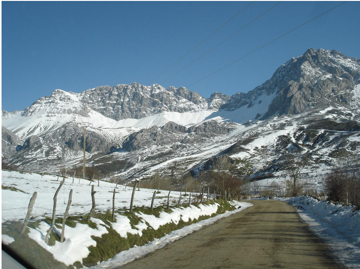
Foto: Torrebarrio. De Jlcgdos -, https://commons.wikimedia.org/w/index.php?curid=5000717

Desde allí ascenderemos al Collado del Ronzon (1.937 m), desde donde podremos contemplar las vertientes leonesa y asturiana.